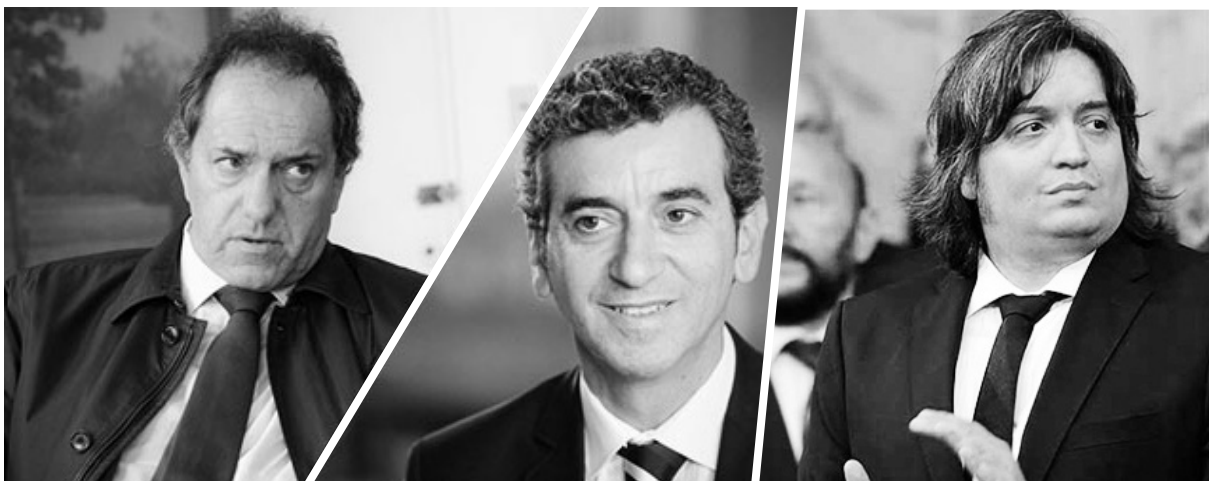
¿Estos son los candidatos para "combatir a la derecha"?

Scioli hace guiños. Cambió el color naranja de sus afiches por el celeste, funcional a los K. Elogia a Kicillof. Jorge Telerman, funciona-