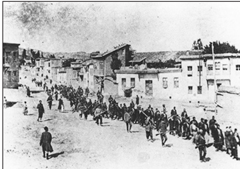
1915: armenios en la ciudad turca de Urfa, cercana a la frontera con Siria, camino al exilio y las masacres

Los crímenes de lesa humanidad no prescriben por el paso del tiempo. El pueblo armenio nunca bajó los brazos con su reclamo. Muchos gobiernos y miles de lu-