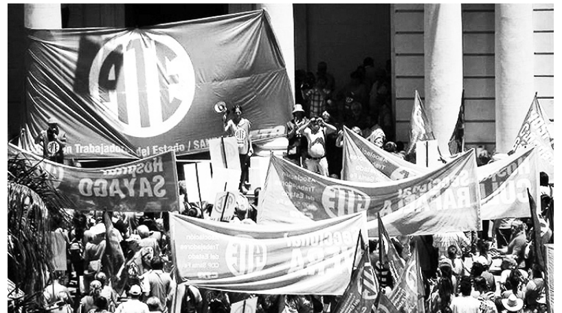
ATE debe dejar de ser un gremio testimonial

La propia asamblea dejó en evidencia la crisis en la seccional Capital. En primer lugar, porque el grueso de la concurrencia lo aportó la delegación de ATE Congreso, que solo participa de la vida del sindicato para estos eventos burocráticos. Segundo, porque se expresó un importante sector de delegados y activistas de la Verde con fuertes cuestionamientos a la conducción nacional y de las seccionales. Estos compañeros son parte de juntas internas que han estado en la calle enfrentado el ajuste y a los aprietes del gobierno K (INTI, Ministerio de Justicia y el INDEC). Presentaron una lista alternativa para la Junta Electoral que perdió ajustadamente frente a la de la conducción. En su intervención, manifestaron su voluntad de rediscutir de cara a las próximas elecciones la conformación de