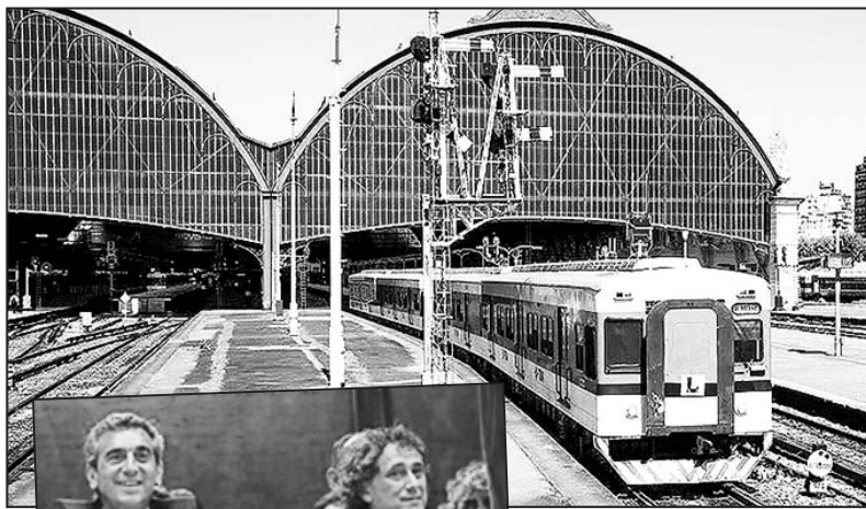
Randazzo y Sasia (Unión Ferroviaria) festejando la aprobación en diputados

El diputado de Macri, Federico Sturzenegger, fue muy claro al respecto. "Este proyecto logra un balance con un Estado que invertirá en la infraestructura necesaria mientras que le permite al capital privado competir en la operación de manera sana" (Página 12, 9/4). Felipe Solá, que responde a Massa, señaló: "Este es un proyecto de reor-