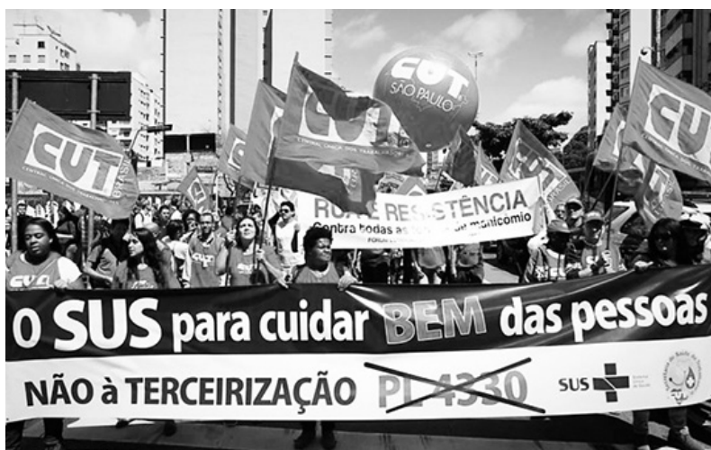
La protesta se hizo sentir este 15 de abril

El paro se da en un marco de crisis económica y política del gobierno del PT y de un duro plan de ajuste antipopular, lanzado después de que Dilma Rousseff consiguió su reelección prometiendo “enfrentar a la derecha”. Pero resulta que el ministro de Economía actual es un representante de los banqueros, que se llevan la mitad del presupuesto nacional en pagos de la deuda esta-