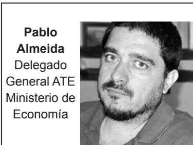
Pablo Almeida Delegado General ATE Ministerio de Economía

El 8 de abril se realizó la asamblea anual de afiliados de la Seccional Capital de ATE en el mini estadio de Argentinos Juniors, con alrededor de 2.000 compañeros. Se dio en el marco del recrudecimiento de la crisis y las divisiones al interior de la lista Verde que durante los últimos 30 años ha conducido el gremio. Desde la oposición antiburocrática realizamos críticas a la conducción y llamamos a organizar un plan de lucha