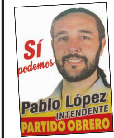
Afiches de campaña del Partido Obrero en el FIT

El pasado domingo 12 de abril se llevaron a cabo las PASO en Salta. Se votó a gobernador, diputados provinciales, intendente y concejales. La lista del Partido Obrero en el Frente de Izquierda hizo una muy buena elección. Salió tercera fuerza a gobernador. Y tuvo los candidatos más votados a diputados y concejales de Capital, si bien en este distrito la suma de los votos de las distintas colectoras llevó a que ganara la lista de Romero.